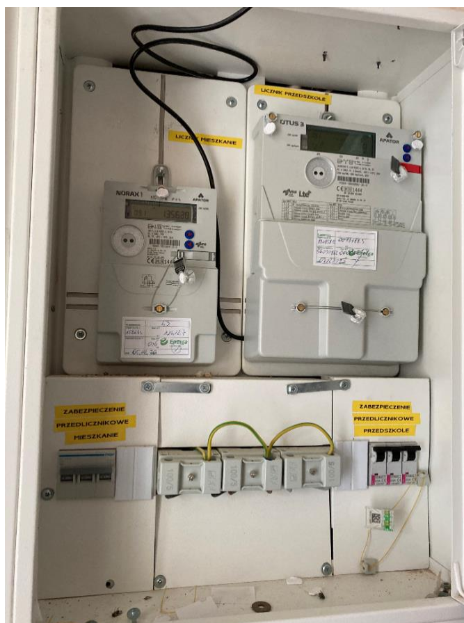
Zdj. nr 1 Tablicy Licznikowej przy wejściu głównym

Instalacja elektryczna w pozostałych pomieszczeniach jest kompletna i posiada aktualne badania okresowe.