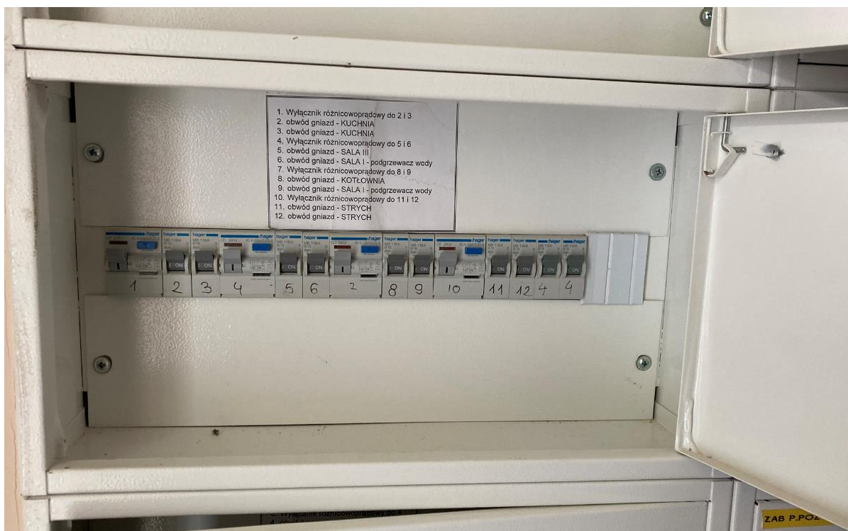
Zdj. nr 3 Rozdzielenia Głównej