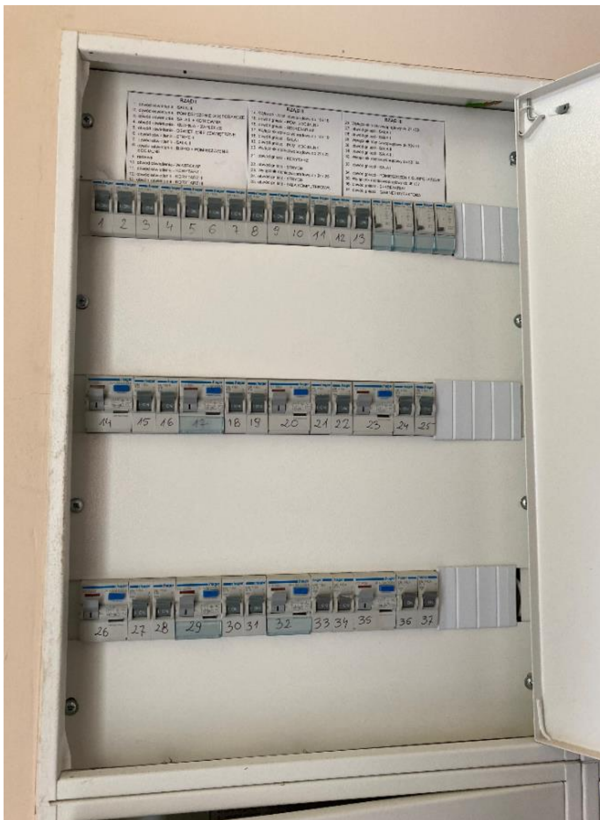
Zdj. nr 2 Zdjęcie Rozdzielni Głównej