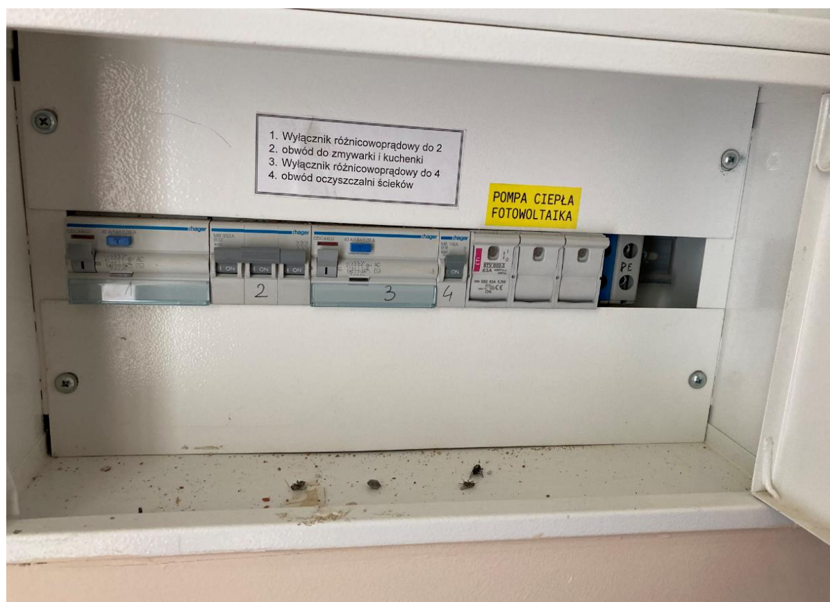
Zdj. nr 4 Rozdzielnia Główna